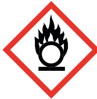
GHS 03 Oxidising