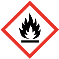
GHS 02 Flammable