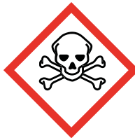
GHS 06 Acute toxicity