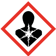
GHS 08 Serious health hazard