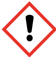
GHS 07 Health hazard/Hazardous to the ozone layer