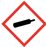
GHS 04 Gas under pressure