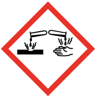
GHS 05 Corrosive