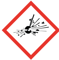
GHS 01 Explosive